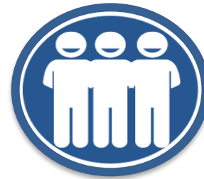
Esquemas de participación y representación