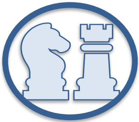
Preparación equipo directivo y negocio

Asegurando la implementación de la estrategia laboral con base en la identificación de riesgos, sensibilización del negocio y definición de las acciones clave de protección, preparación y consolidación: