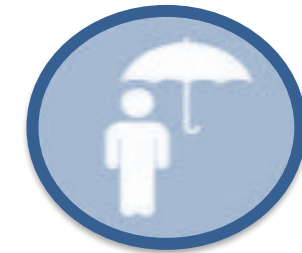
Manejo de crisis

Habilitamiento y soporte de acompañamiento