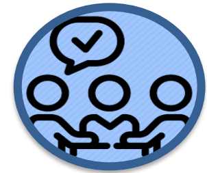
Influencers internos y comunicación