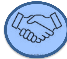
Estrategia manejo sindical Y Negociación CCTs